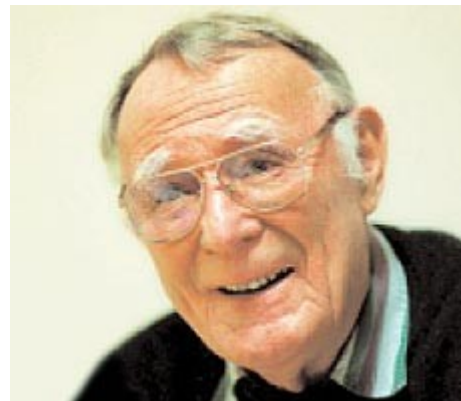
Основатель IKEA Ингвар Камрад

Предлагаемая продукция имела четкие дифференцирующие черты. Все было простым, качественно сделанным, по-скандинавски элегантным. Все продавалось в разобранном виде для самостоятельной сборки покупателями, что снижало цену и срок доставки из магазина (чем отличаются другие мебельные фирмы). Огромные пригородные магазины имели огромные парковки, рестораны, детские игровые комнаты, инвалидные кресла и т.п. Покупатели ожидали стиля и качества по разумным ценам. IKEA реализовала эти ожидания, предоставляя покупателям возможности самостоятельного создания ценности путем исполнения функций, традиционно отдаваемых производителю или продавцу: например, доставка и сборка. Разумеется, это также снижало издержки. Также на это работало и то, что покупателям в торговом зале выдавались бумажные «метры», карандаши и блокноты для записей – требовалось меньше продавцов.